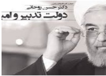
دکتر حسن روحانی برای یک دوره ۴ ساله رئیس جمهور ایران شد

و در عرصه داخلی تاکید کرد: جامعه ما ظرفیت‌های شناخته و ناشناخته زیادی دارد و با اتکا به سرمایه‌ها می‌توان به این هدف دست پیدا کرد. البته باید فضا و فرصت خدمت برای تمام ایرانیان باز شود و بگذاریم که شایستگان بر ملت خدمت کنند و سینه‌ها از کینه‌ها پاک شود و اجازه دهیم که آشتی جای قهر و دوستی جای دشمنی بنشیند و اسلام با چهره رحمانی خود و ایران با چهره عقلانی خود و انقلاب با چهره انسانی خود و نظام با چهره عاطفی خود حماسه بیافریند.