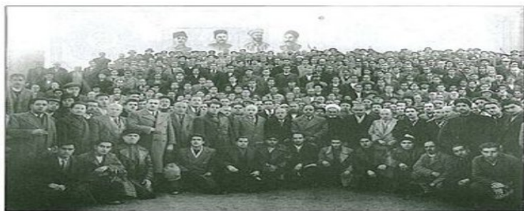
گروهی از رهبران و فعالان فرقه دموکرات آذربایجان. زیر تصاویری از ستارخان، خیابانی، باقرخان و حیدرخان عمومی